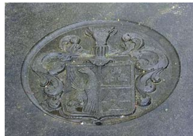
Wapen van de familie Poppes op het familiegraf in Harich.