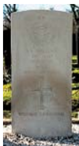
Oorlogsgraven in Bakhuizen (links) en Nijemirdum.