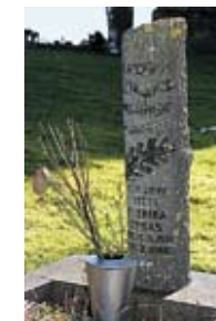
Islamitische graven in Nijemirdum

Wie na het lezen van dit alles nieuwsgierig is geworden moet zelf maar eens een kijkje gaan nemen op een van de begraafplaatsen in de gemeente. Dan zal ook nog een ander fenomeen wellicht opvallen: de rijke symboliek op de grafmonumenten. Al met al een rijke funeraire traditie die het waard is om nader te beschouwen en zeker ook om voorzichtig mee om te gaan. Dat dit laatste niet voor niets wordt gezegd mag blijken uit het feit dat in Gaasterlân-Sleat nog maar twee graftrouwen voorkomen. Graftrouwen of kransdozen kwamen vanaf eind 19de eeuw veelvuldig voor maar werden na de jaren vijftig en zestig steeds minder geplaatst. In Fryslân is deze graftrouw nog ruim vertegenwoordigd, maar helaas zijn de meeste in deze gemeente verdwenen.