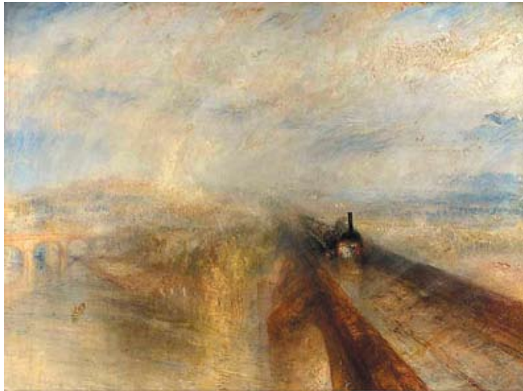
William Turner, 'Rain Steam and Speed - The Great Western Railway', 1844