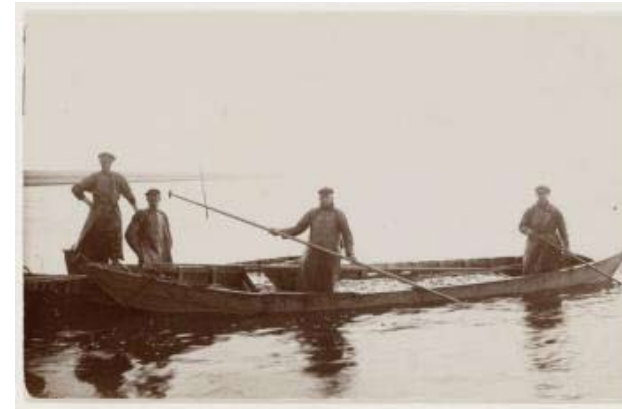
Haringvissers van Won 11 van Makkum begin 1900.

3 septembar 1899. Aldemardum. Us fiskers kleie slim oer de minne gong fan saken. Dat komt yn haadsaak troch de mannichte oan krabben. Tsjin harren fernielingswurk is neat bestand. Elke moarn sitte de netten d'r sawat fol mei. Der wurdt sa gjin fisk(iel) fongen en de netten oan rampoi.