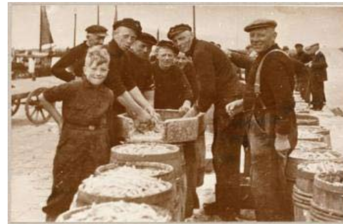
Workumer visser met tonnen ansjovis rond 1920.

27 septembar 1900: Laaksum De ielfiskers hawwe fannacht fiks wat fongen. Dat wie te tankjen oan de geunstige wyn.