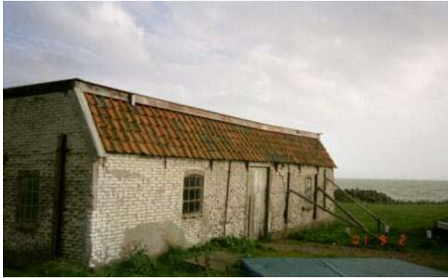
“De Hang”. Voormalige visafslag in Laaxum