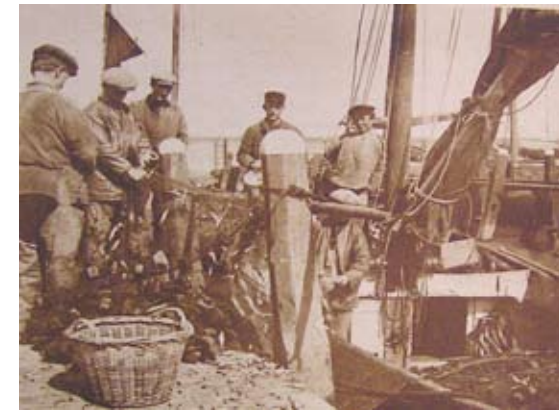
De Staverse vissers zijn in 1928 bezig de ansjovis uit de netten te halen.

24 juni 1896. Aldemardum. Oan ús Suderseekusten hat men it de leste wiken tige drok mei de ansjofiskfangst. Der lizze likernôch 50 jollen. In fisker út Warns fong inkele dagen lyn yn twa nachten foar f. 100,- De priis is f. 9,- de 1000 stiks.