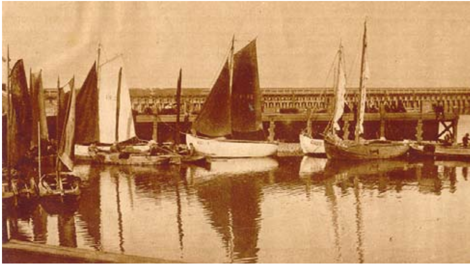
Staverse jollen in de haven van Hindeloopen 1928.

31 januari 1898: Starum. Troch de ansjofiskfiskers hjirwei en út de kustplakken út 'e buert binnen yn 'e leste dagen leveringskontrakten mei de opkeapers ôfsluten. Yn de leste jierren wurde hjirby oan de fiskers preemjes útkeard fan f 20,- oan 't f.25,- dy 't letter by it leverjen fan de fiskjes ferrekkene wurde.