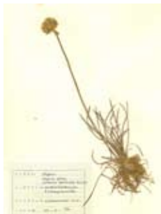
Seegers út herbarium fan de auteur, 1958

Kom mei, wy sille it âlde Marderklifris opsykje; wy litte ús by de hichte delglide nei it strân. Sjoch, dêr waakse alderhanne aardige planten: alderearst de blauwe stikel; wat fierder in oare neibesibbe, mar wat grienere plant, de krússtikel, dan it molkrûd, de seeposlein ensafuorthinne.'