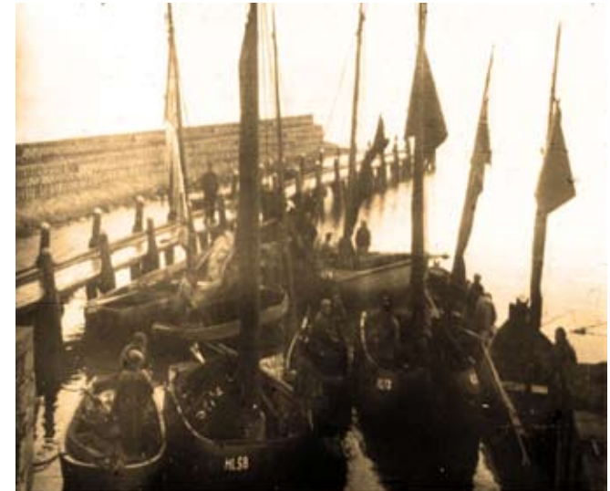
Sfeerfoto van het insteekhaventje bij Molkwerum rond 1930