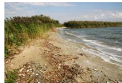
Kriik (oanspielsel) mei skulpen by de Mokkebank

Oer de hiele Iselmarkust besjoen binne der uteraard pleatselike ferskillen. Op de ouwers – âlde strânwâlen- om Laaksum hinne, binne no noch wol wat oerbliuwsels fan sâltwetterplanten te finen. Sa ha ik dêr ôfrûne simmer noch inkele eksimplaren fan it molkrûd fûn en dêr is ek noch in hoekje mei helm. It seegers, dat der noch jierren stien hat, ha ik lykwols net sjoen. Op de ouwers fan de Huitenbuursterbûtenpolder komt noch in hiele pôle helm foar en ek in pear eksimplaren fan it molkrûd.