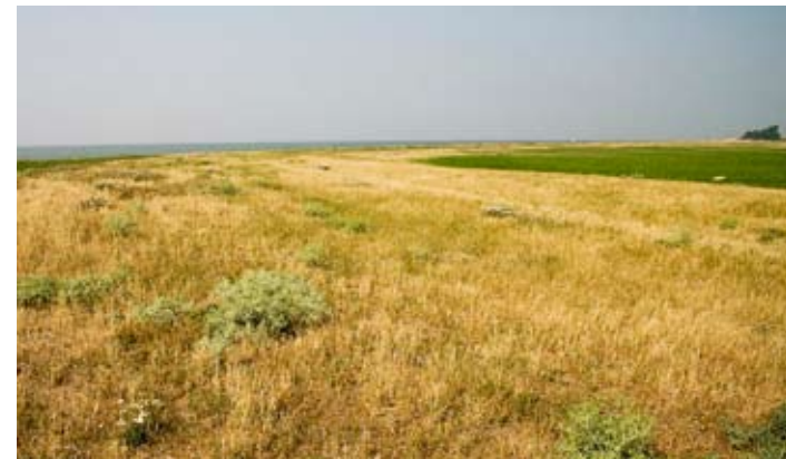
Ouwers by Laaksum yn droege simmer mei súsnstikel