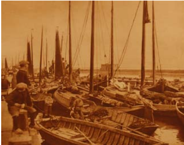
Drukke in de haven van Lemmer na haringvangst 1930.

Als er iets veranderd is na de aanleg van de afsluitdijk in 1932 is het wel de visserij. Het beeld van de haven van toen en nu is totaal veranderd, waar destijds de vissersboten lagen, liggen nu de talrijke plezierjachten. Om een indruk te krijgen van de visserij ten tijde van de Zuiderzee heb ik een aantal citaten uit oude balksterkranten van 1874-1901. Deze alde krantenijtsjes zijn bij elkaar gezocht door W.T.Beetstra en geplaatst in de Balkster Courant van 1980.